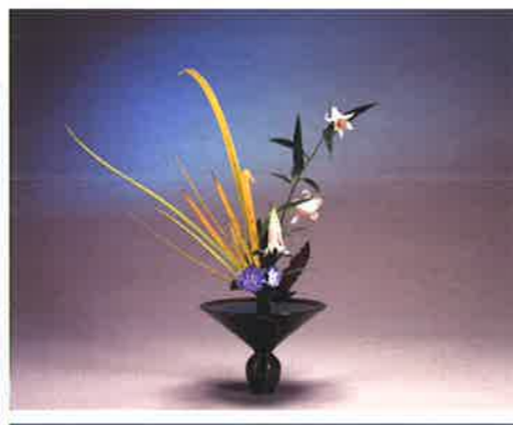
池坊本部 Ikenobo Headquarters, Kyoto, Japan HP: http://www.ikenobo.jp/english/ Email: intevent@ikenobo.jp